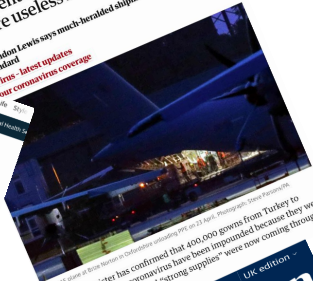
▲ An RAF plane at Brize Norton in Oxfordshire unloading PPE on 23 April. A cabinet minister has confirmed that 400,000 gowns from Turkey to protect medics from coronavirus have been impounded because they were poor quality, but he insisted "strong supplies" were now coming through to the frontline.