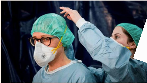
The initial order included a request for 400,000 surgical gowns.

Ankara rescues RAF supply mission after lack of export licence scuppers order